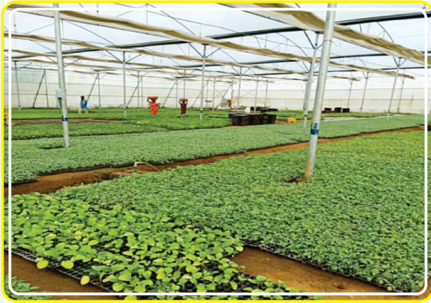
Innovating & Learning